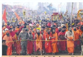
संगम क्षेत्र पर स्नान करने के लिए अपनी बारी के लिए प्रतीक्षित अमराठी के लोग