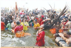
अमृत स्नान के दौरान लोग की घाट में कलश टिकाती महिलाएं