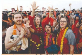
संगम तट पर अमृत स्नान में शामिल होने दिव्य भय्य और अमृत